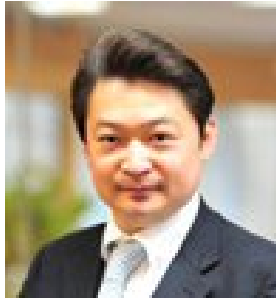
記者会見 の様様です