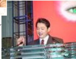
イベントの時の プレゼン様様です